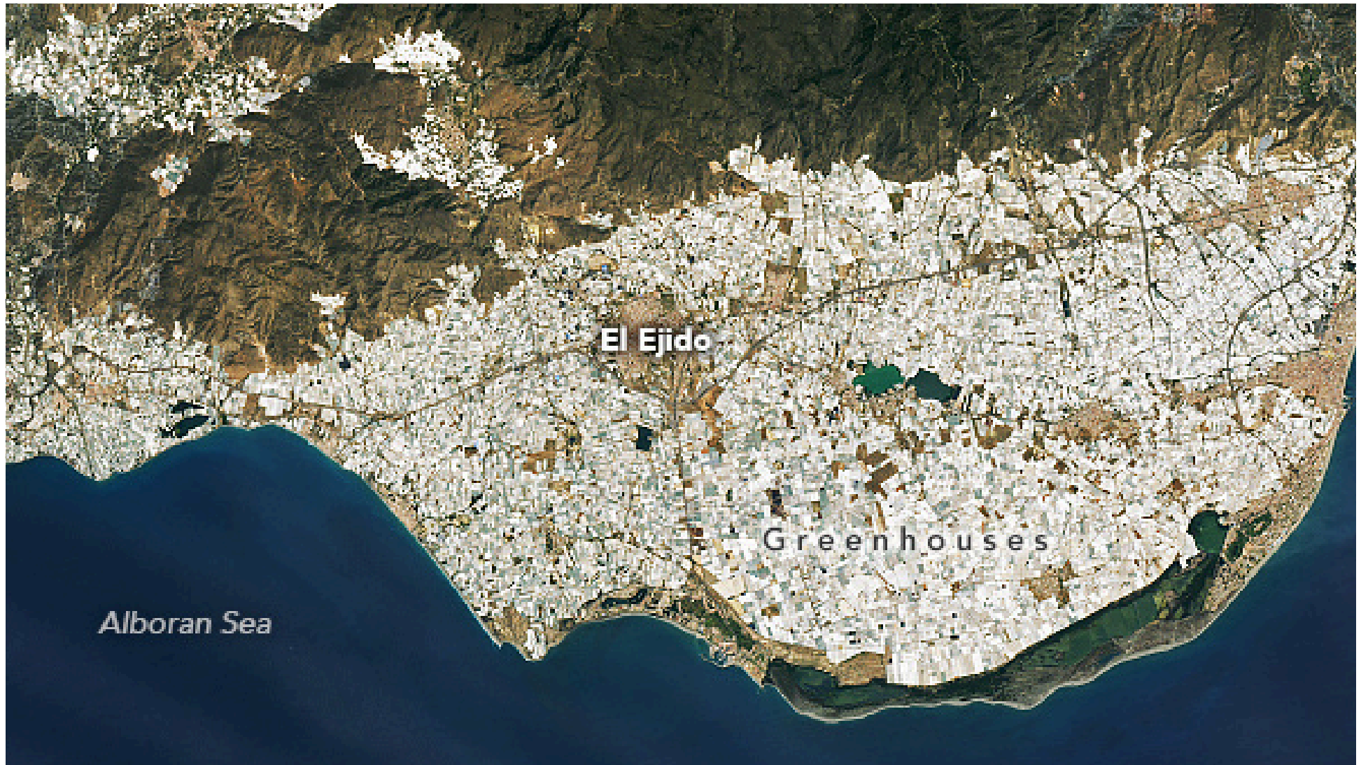
Green House City, Sydspanien (satellitfoto)