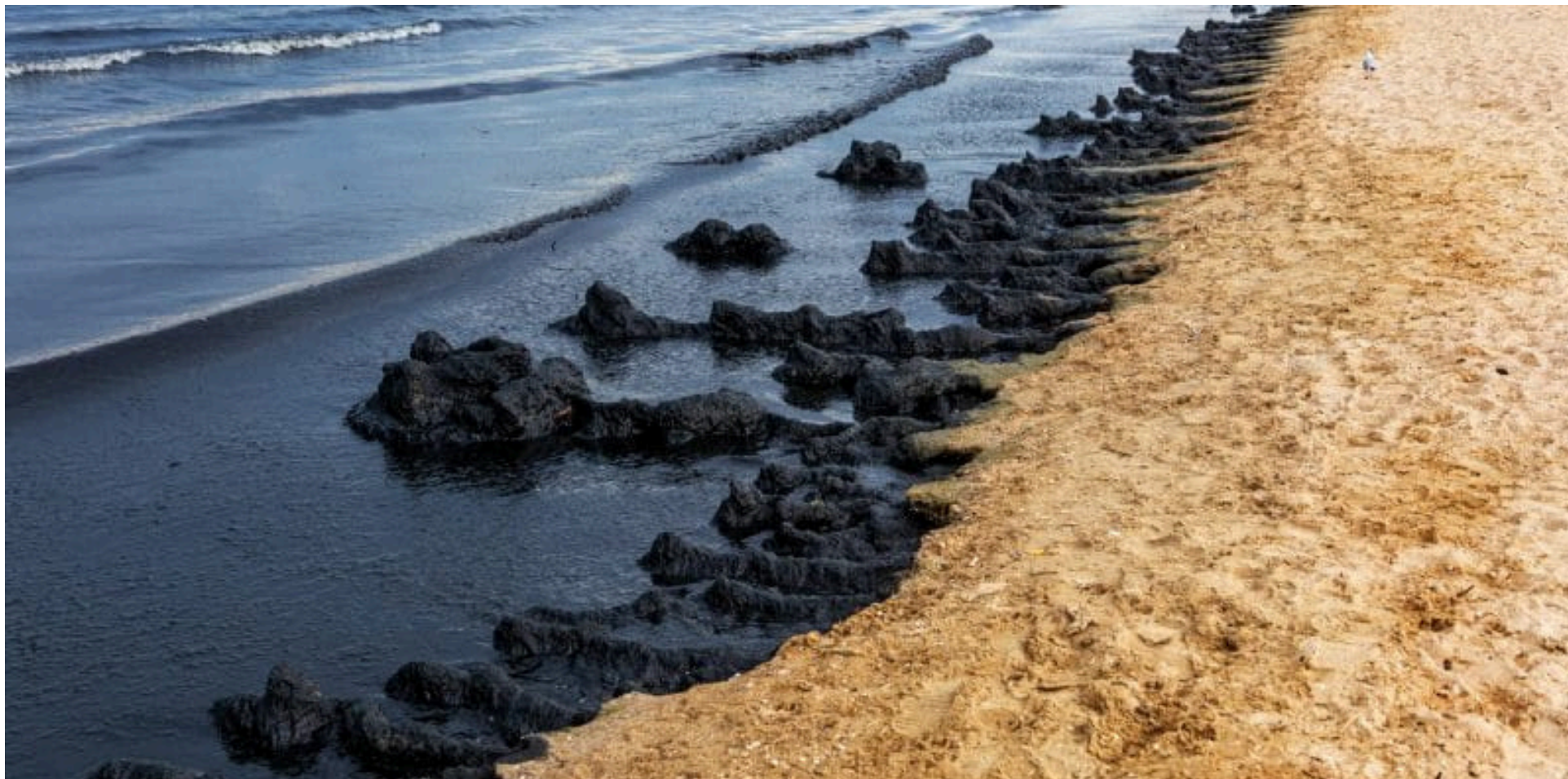
Olieudslip, ukendt sted