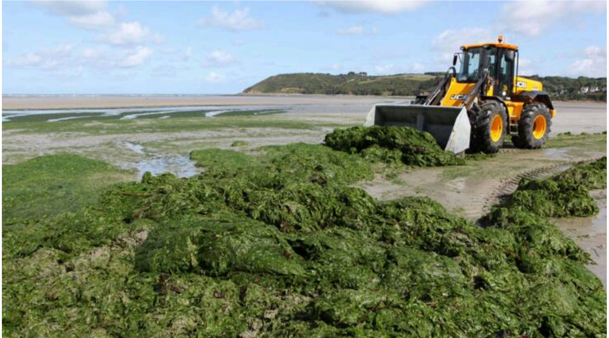
Ekstrem algeforkomst, Frankrig