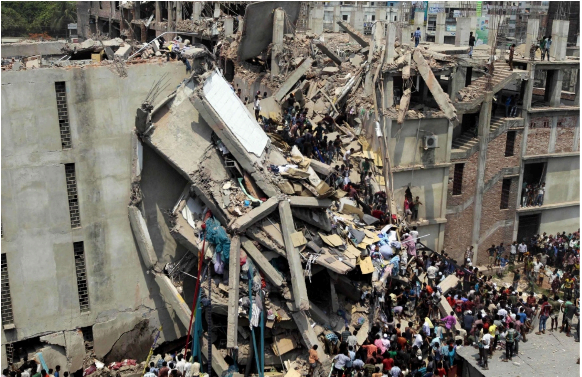
Sammenstyrtet fabrikk, Rana Plaza, Bangladesh (2013)