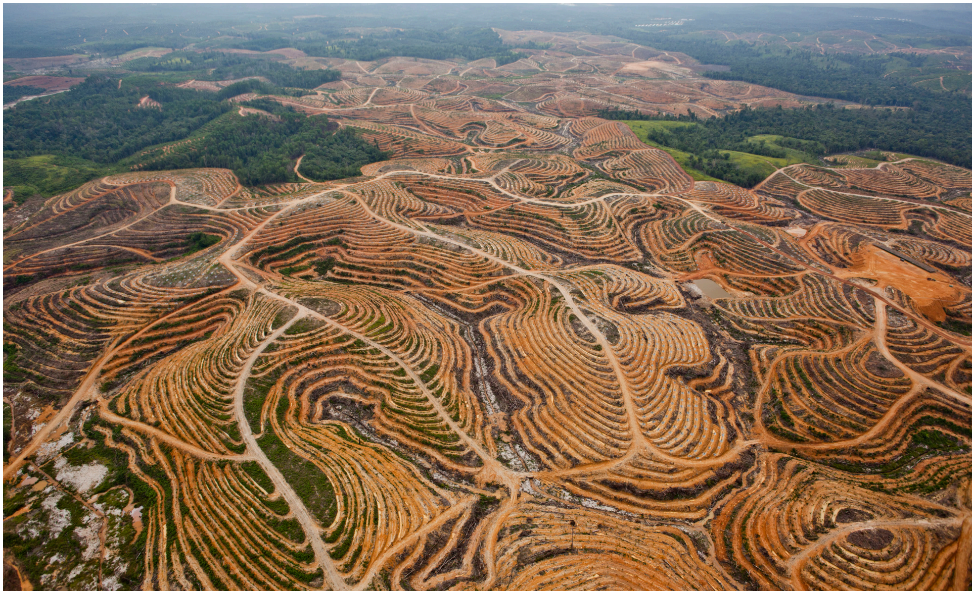
Ryddet palmeolieplantage, Indonesien