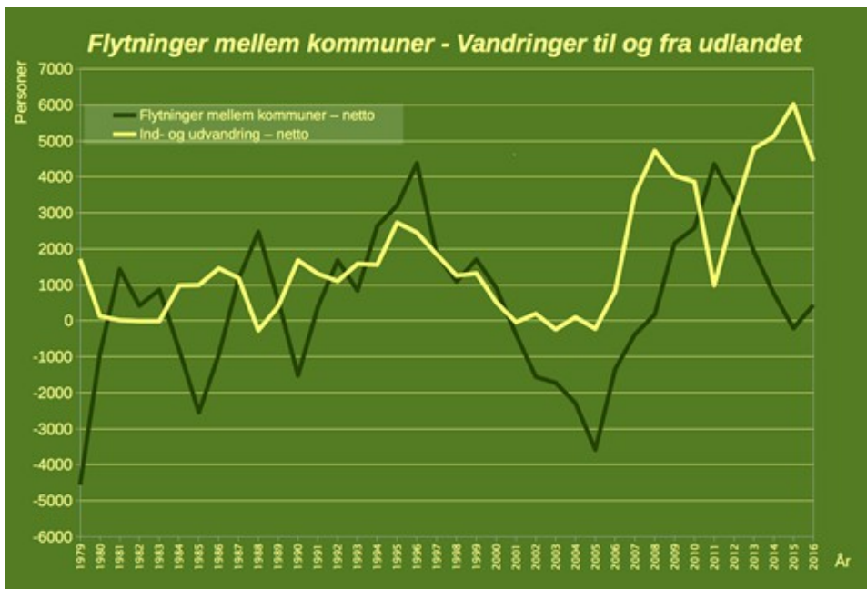
Graf 1: Nettoflytninger fra andre kommuner til København (sort) og nettoindvandring fra udlandet (gul).