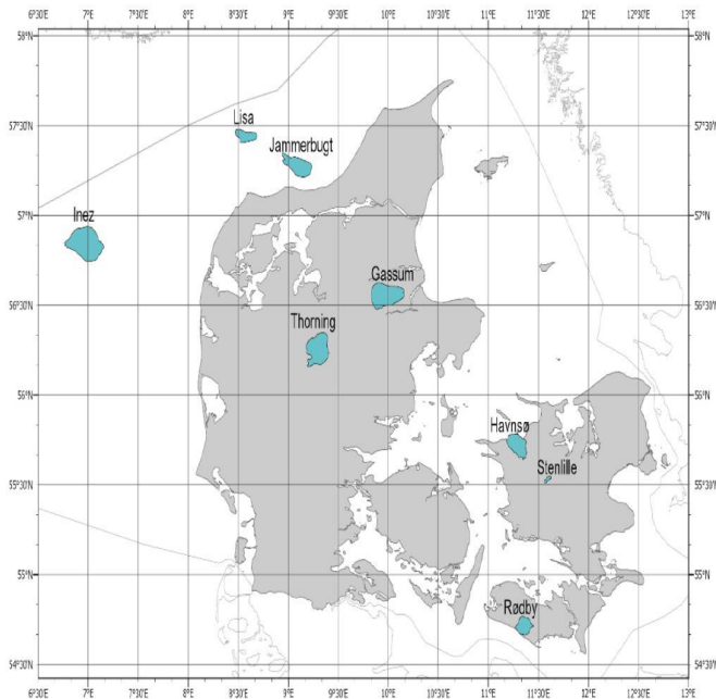
Figur 1-1 – Områder i udbuddet for geologisk lagring af CO 2 .

Figur 1. Fra afgrænsningsnotat november 2022 - plan for udbud. Med de oprindelige planområder.