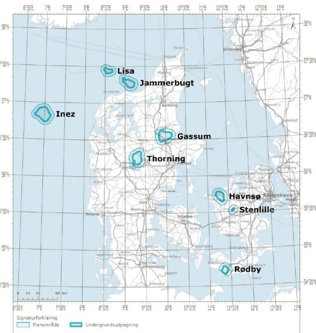
Figur 2-1 Områder i udbuddet for geologisk lagring af CO 2 .

Figur 1. Fra afgrænsningsnotat november 2022 - plan for udbud. Med de oprindelige planområder.